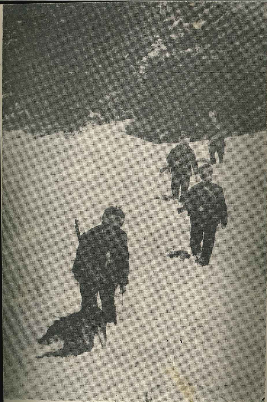
Çmimi 4 lekë