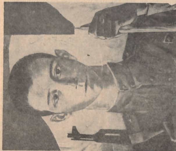
Fragment i tabllës S. B. Shatohinit «Ushtari i vendit të Sovjetëve» dhe fragment i një afresku të shekullit XII në Vladimir, Rusi. Është fare e qartë fryma e përbashkët mistiche.